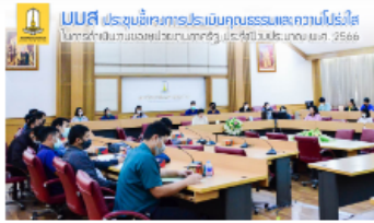
มมส ประชุมชี้แจงการประชุมเป็นคุณธรรมและความโปร่งใส