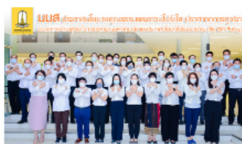
มมส ประกาศนโยบายคุณธรรมและความโปร่งใส ในการจัดการศึกษา

🕒 ๑. 21 มีนาคม 2566 14:08:18 น. 👁 2 ครั้ง