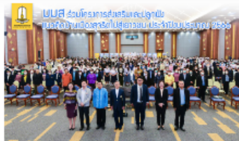
มมส ร่วมโครงการส่งเสริมและปลูกฝังแนวคิดบ้านเมือง สุจริตไปสู่เยาวชน ประจำปีงบประมาณ 2566

🕒 ๑. 21 มีนาคม 2566 11:04:10 น. 👁 2 ครั้ง