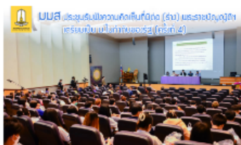
มมส ร่วมรับฟังความคิดเห็นที่มีต่อ (ร่าง) พระราช บัญญัติฯ เติร์มเป็น ม.ในกำกับของรัฐ (ครั้งที่ 4)

🕒 ๑. 21 มีนาคม 2566 11:11:20 น. 👁 1 ครั้ง